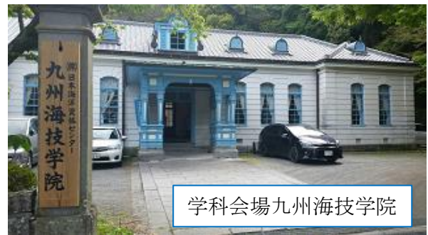
学科会場九州海技学院