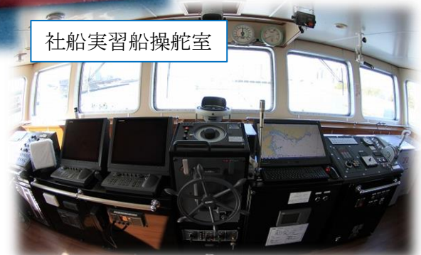
社船実習船操舵室