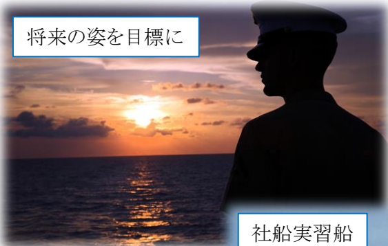
将来の姿を目標に