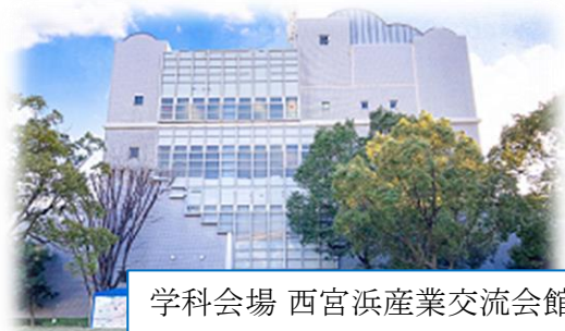
学科会場 西宮浜産業交流会館