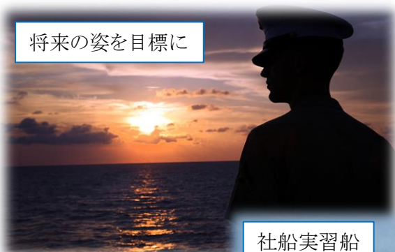
将来の姿を目標に

座学2.5ヶ月と社船実習2ヶ月を修了され、その後6ヶ月（有給休暇を除く）の乗船勤務を経て、身体検査基準に合格することで六級海技士（航海）の免状が取得できます。