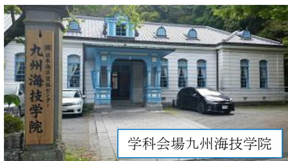
学科会場九州海技学院